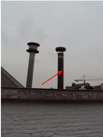
Photo 1 Arrière cours, toit, tuyaux