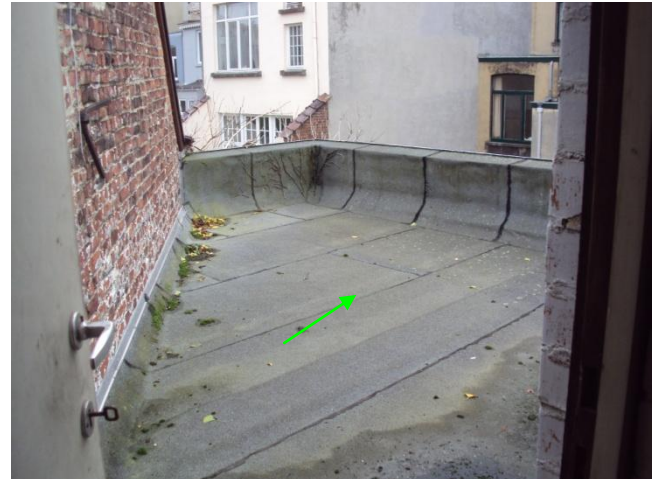
Photo 2 Arrière cours, toit, roofing