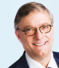
De burgemeester Vincent DE WOLF

Wij hopen dat u uw gading zult vinden en wij zien u graag op 7 oktober 2022 om samen het glas te heffen.