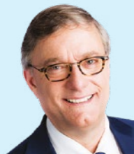
Votre bourgmestre Vincent DE WOLF

Nous espérons que vous trouverez votre bonheur dans cette nouvelle programmation, et nous vous donnons rendez-vous le 7 octobre 2022 pour le verre de l'amitié.