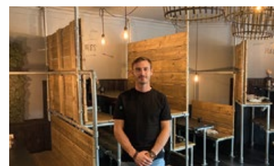
12. Restaurant « Poule&amp;poulette Jourdan »