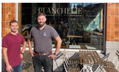
9. Bar à vin « Planchette »