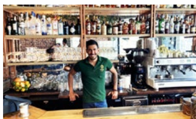
7. Bar « Kosmos »