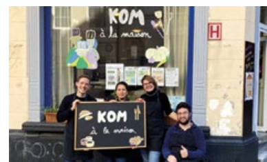
8. Restaurant solidaire « KOM à la maison »