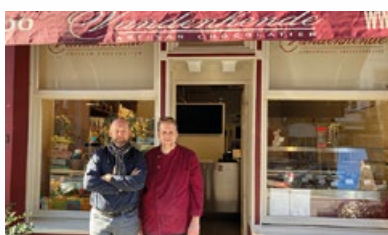
13. Chocolaterie « Vandenhende »