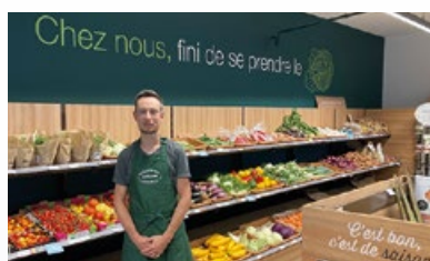
14. Magasin d'alimentation « Séquoia Jourdan »