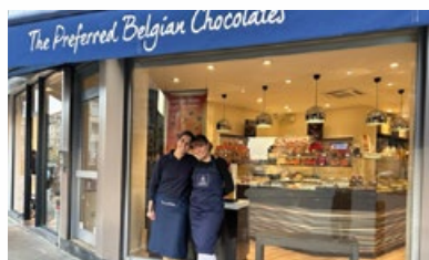
6. Chocolaterie « Léonidas La Chasse »