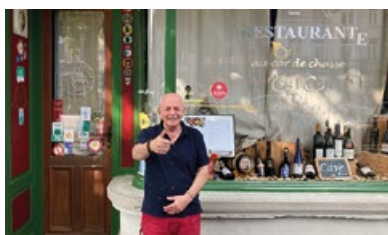
1. Restaurant « Au Cor de Chasse »

Il y a quelques mois, la commune d'Etterbeek lançait le label « Commerce engagé pour la Propreté ». Destiné aux établissements Horeca et à ceux qui vendent de l'alimentation, ce label vise à encourager les professionnels à s'investir durablement pour garantir la propreté autour de leur espace commercial. Découvrez les seize premiers participants labellisés.