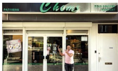
2. Pâtisserie « Chems »