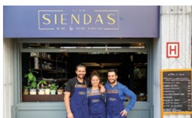
15. Restaurant « Siendas »