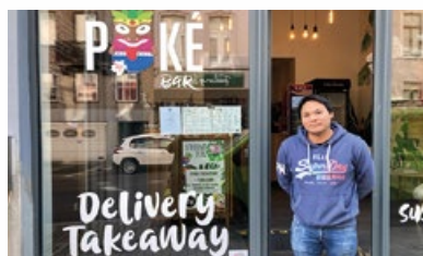
10. Snack « Poké bar »