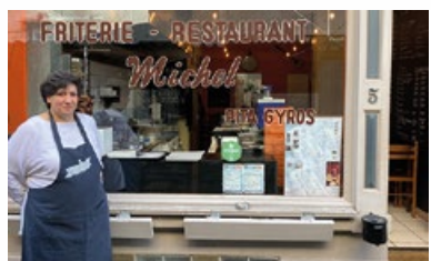
5. Restaurant « Michel »