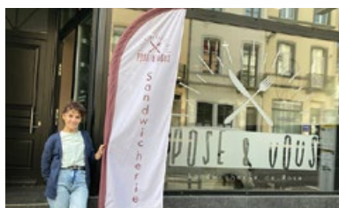
11. Snack « Pose&amp;Vous »