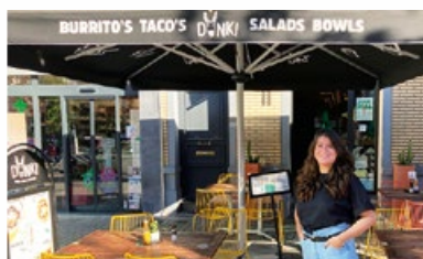
3. Restaurant « DonkiJourdan »