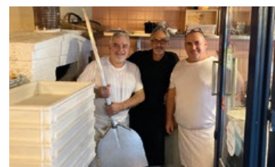
4. Restaurant « Il Sorriso »