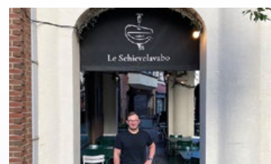
16. Restaurant « Le Schievelavabo »

Impossible pour une commune d'assurer seule la propreté des rues. Il s'agit d'un véritable enjeu de société qui concerne l'ensemble de la population. Consciente que l'exemplarité est l'une des meilleures armes pour encourager les citoyens à maintenir les rues propres et donc plus agréables, Etterbeek s'est adressé à des commerçants particuliers.