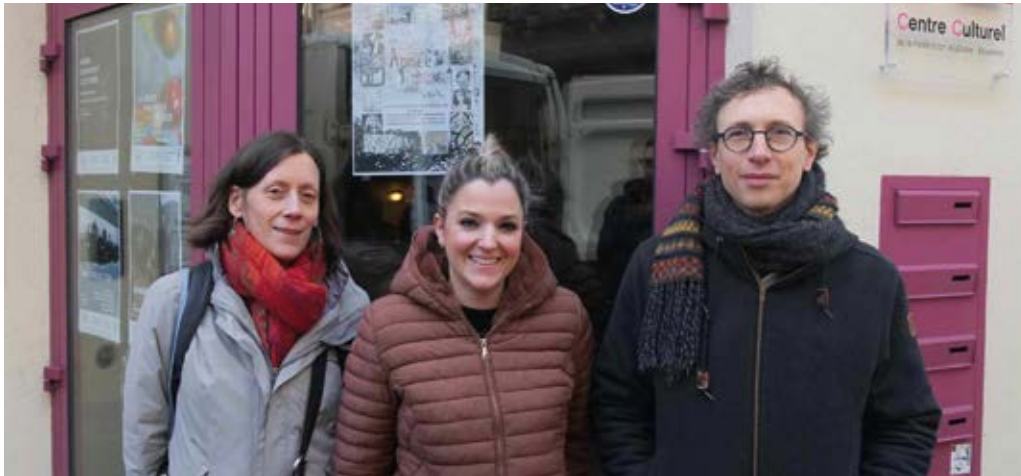
Le metteur en scène en compagnie de deux représentantes de la cellule « médiation de dettes » du CPAS.

Deux représentations théâtrales gratuites au Senghor à l'initiative du CPAS d'Etterbeek.