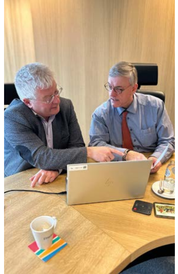
Le bourgmestre et l'échevin des Finances au travail.

Pour garder le cap face à ces dépenses indispensables, le collège va limiter les budgets liés aux dépenses de fonctionnement en 2023 à hauteur de 70%. Des efforts qui ne se feront pas au détriment des citoyens mais qui se traduiront par exemple par une limitation d'achats de mobilier ou un étalement des engagements.