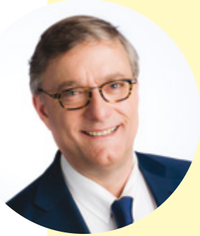
VINCENT DE WOLF BOURGEMESTRE BURGEMEESTER MAYOR

La place Jourdan va connaître un nouveau visage en 2018. Une place plus conviviale, plus verte et plus spacieuse pour l'ensemble des habitantes et habitants verra le jour. Ce sont des dizaines de milliers de personnes qui chaque année convergeront vers le marché, les commerces et les fêtes populaires sur une place encore plus accueillante! Ce sera aussi l'occasion de déguster les célèbres frites de la toute nouvelle Maison Antoine!