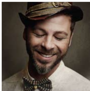
© Endemol - Christophe Maé - Bastian Baker