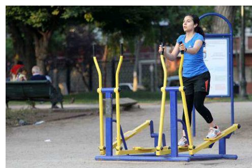
Jeux pour les adolescents (2)