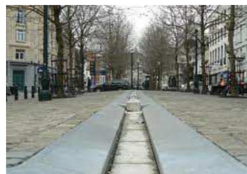
Jeux d'eau (3)