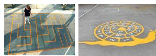
Jeux au sol (marelles, labyrinthes,...)