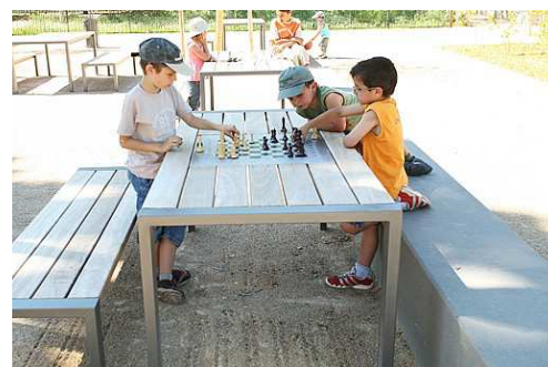
Tables de jeux