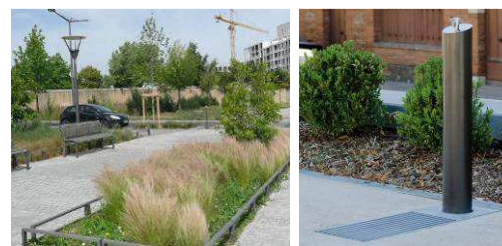
Type de végétation, parterres de graminées Fontaine à eau potable