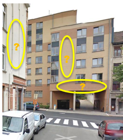
Vue depuis avenue du Préau