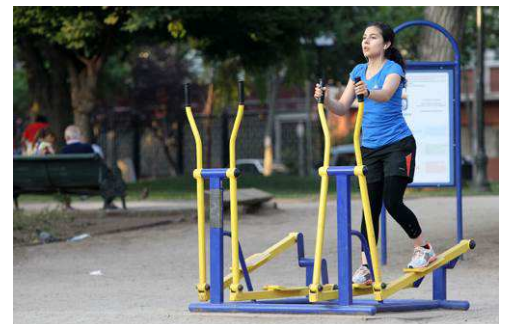
Speeltoezien voor adolescenten (2)