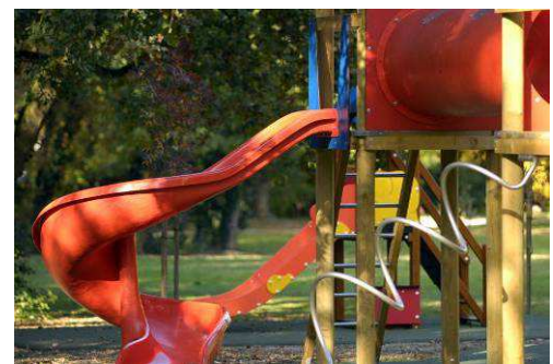
Speeltuigen voor kleine kinderen (2)