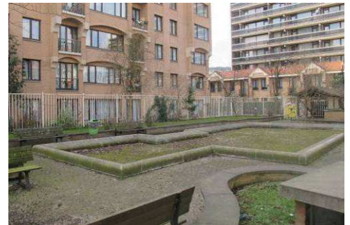
Oude zandbak, Sorelo-ruimte