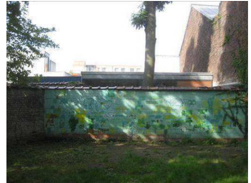
Zicht achteraan in de tuin van Maison des Enfants

De nieuwe locatie van de club wordt door de gemeente actief onderzocht.