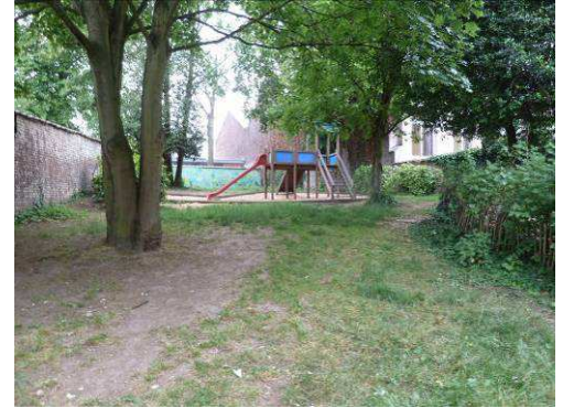
Tuin van het « Maison des Enfants »

De tuin van het "Maison des Enfants", gelegen te Oudergemlaan 233, biedt ook mogelijkheden voor een opwaardering, een openstelling en een verbinding met de toekomstige ludotheek (oude petanqueclub), de nieuwe polyvalente zaal en de speelplaats van de school.