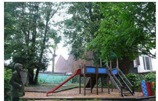
Speelmodule van de tuin van Maison des Enfants