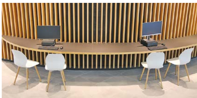
De openbare computerruimte op de benedenverdieping van het gemeentehuis (Kazernenlaan 31/1) is open van maandag tot en met vrijdag van 8 uur tot 16 uur en op dinsdag tot 19 uur (behalve in juli en augustus).

Zowat overal in Brussel vind je openbare computerruimtes (OCR) waar je gebruik kan maken van computers met internetverbinding en de meest voorkomende computerprogramma's. Je kan de computers gratis gebruiken, bijvoorbeeld wanneer je op zoek bent naar een job, om administratieve stappen te ondernemen of om gewoon op het internet te surfen. Op sommige plaatsen kan je ook opleidingen volgen of krijg je computertips.