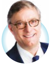
Vincent De Wolf Bourgmestre

Depuis le 1 er juillet 2022, le Code de la route a intégré des règles plus strictes relatives aux engins de déplacements motorisés comme les trottinettes électriques qui en sont le symbole le plus connu. Cette modification permet au service de police de pouvoir intervenir plus facilement et de sanctionner les comportements dangereux. Lors d'une première action, le 6 juillet dernier, 79 conducteurs ont été contrôlés, et nos agents ont dressé 12 procès-verbaux.