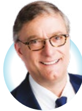
Vincent De Wolf Bourgmestre