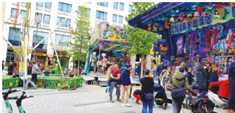
Figure emblématique du calendrier des festivités de la commune, attendue chaque printemps par de nombreux habitants, la foire d'Etterbeek avait cette année dû délaissier son emplacement habituel pour venir s'installer devant le parc du Cinquantenaire en raison d'un imprévu. Cette seconde édition organisée à titre exceptionnel en 2023 représente une aubaine pour les forains habitués à participer à l'événement et fera, on l'espère, également le bonheur des petits comme des grands enfants !

Concrètement, la foire d'automne (re)prendra ses quartiers sur la place Jourdan du vendredi 20 octobre au dimanche 5 novembre inclus. Son inauguration officielle, en présence des autorités de la commune qui prendront à ce moment-là le verre de l'amitié en compagnie des forains et du public présent, aura lieu le 20/10, à partir de 18h.