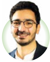
Karim Sheikh Hassan Echevin de la Cohésion sociale et de la Solidarité internationale

L'Automne des solidarités est lancé depuis le 1 er octobre, avec encore de nombreuses activités à découvrir. Il y en a pour tous les goûts, toutes les envies et surtout tous les âges et ce grâce à la collaboration d'un grand nombre d'associations pour cet événement annuel.