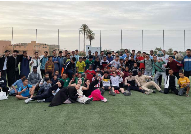
Vriendschappelijke voetbalmatch tussen jongeren uit Etterbeek en Aït Baha.

2 8 februari 2024, station Brussel Zuid: 12 Etterbeekse jongeren zijn klaar om te vertrekken! Bestemming? Aït Baha, voor 10 dagen ontmoetingen en uitwisselingen in deze landelijke gemeenschap in het zuiden van Marokko.