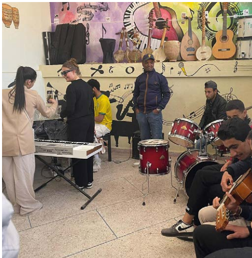
Bezoek aan de gemeentelijke kunstruimte, die werd ingericht dankzij de gemeentelijke internationale samenwerking.

Op het programma: de realiteit van het leven van de lokale bevolking ontdekken, de uitdagingen waarmee ze geconfronteerd worden en de acties die ondernomen worden om de levensomstandigheden te verbeteren. Zo bezochten de jongeren bijvoorbeeld het sociaal-educatief centrum voor mensen met een handicap, het gemeentelijke kunst- en cultuurcentrum en de familietuin. Dit zijn slechts enkele van de projecten die een beter inzicht geven in het dagelijkse leven van de lokale bewoners.