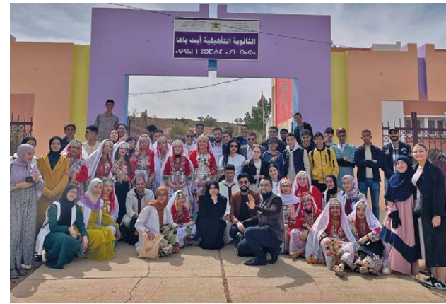
Alle Belgische en Marokkaanse deelnemers en hun begeleiders