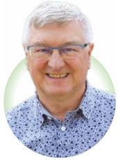
Schepen van Internationale Solidariteit en Sociale Cohesie