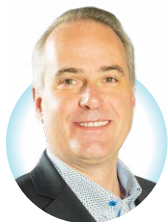
Schepen van Animatie

W e kunnen het moeilijk hebben over de festiviteiten die traditioneel in het voorjaar in Etterbeek worden georganiseerd zonder de middeleeuwse markt en het feest van de Tervurenlaan te vermelden: deze twee evenementen, die typisch zijn voor de Etterbeekse folklore, trekken elk jaar tienduizenden bezoekers (Etterbekenaars, Brusselaars, maar ook mensen van verder weg in België en zelfs het buitenland) en zijn nu niet meer weg te denken voor de vele partners en dienstverleners die erbij betrokken zijn.